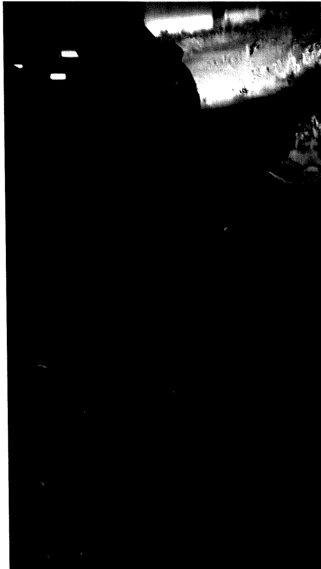
Nery Alves Ribeiro (Nery do Tangará)